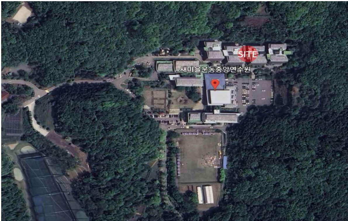
사업부지 항공사진 - 2