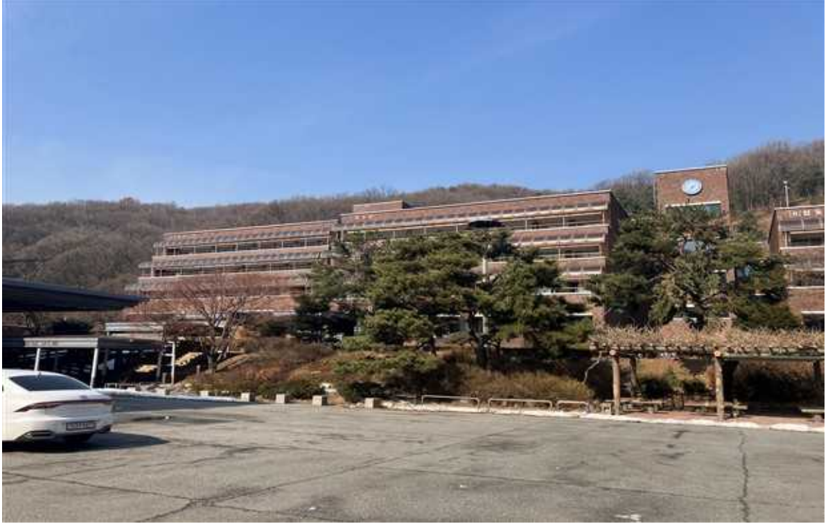
사업부지 위치 - 1