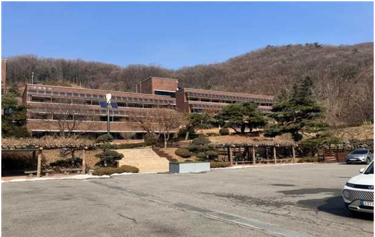
사업부지 위치 - 2