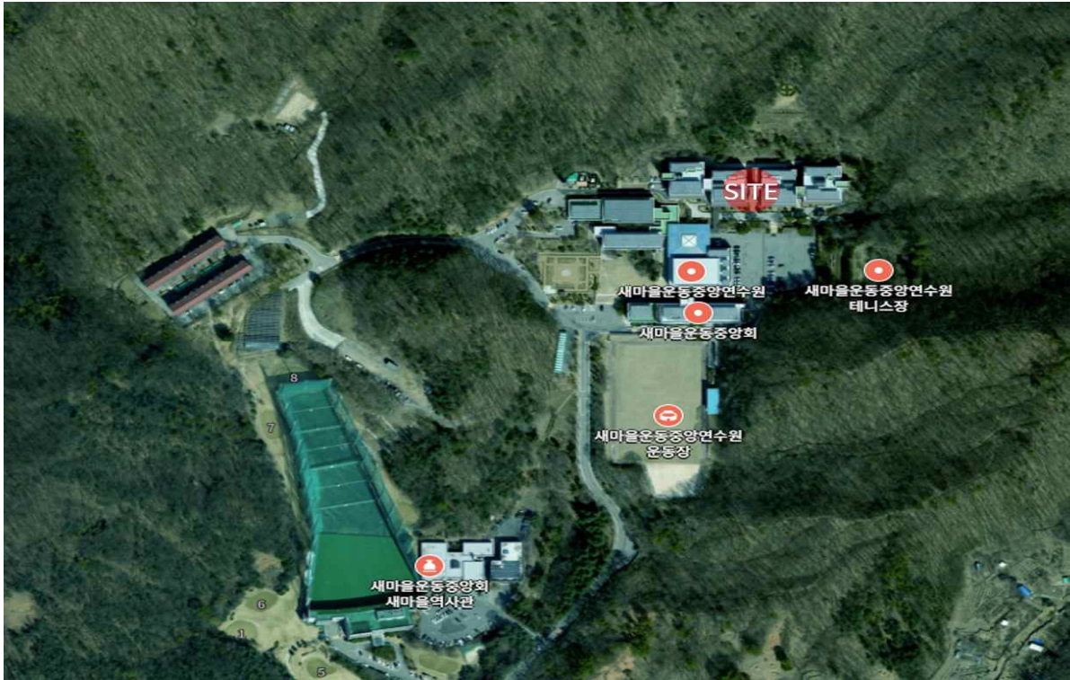
사업부지 항공사진 - 1